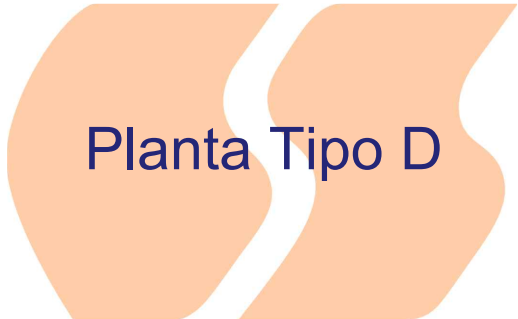
Planta Tipo D