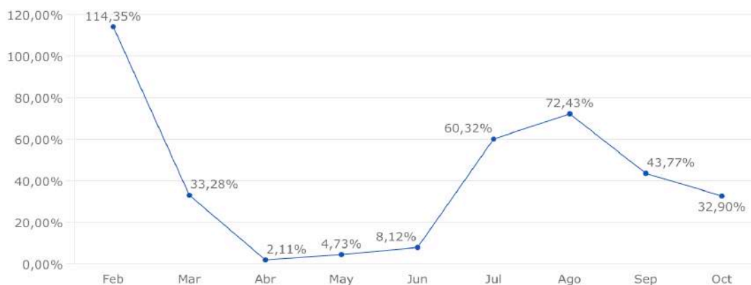
Pernoctaciones m/m-12 (porcentaje de pernoctaciones realizadas respecto a las del año anterior)

Las pernoctaciones en agosto 2020 han sido el 73,43% de las de agosto 2019 y en octubre, el 32,90% de dicho mes en 2019.