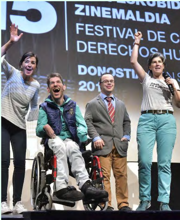
Miembros del equipo del corto Aquí es posible Comunicación S.L.