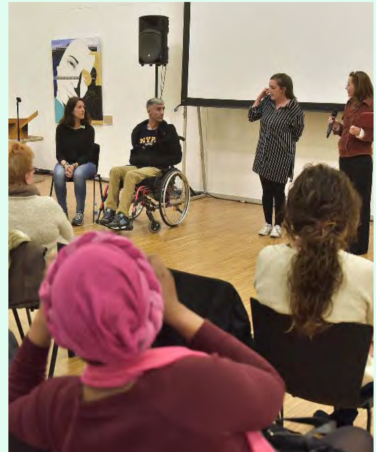
Sesión en el ciclo de Centros Culturales.