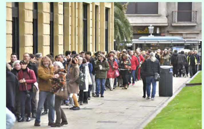
El Teatro Victoria Eugenia es la sede del Festival de Cine y Derechos Humanos.