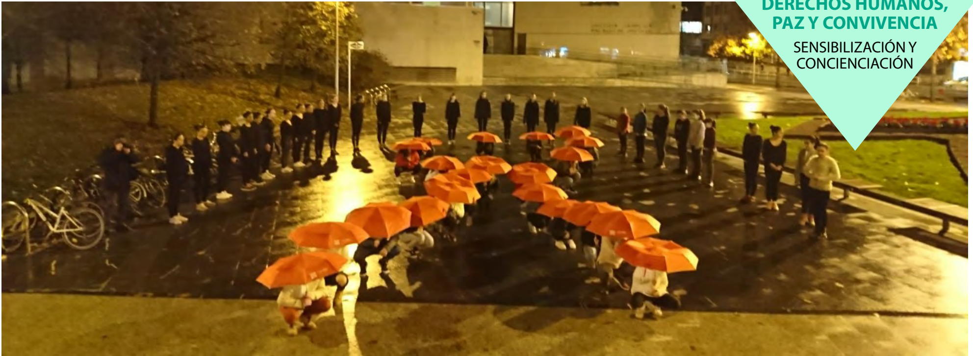
Actuación del alumnado de la Escuela municipal de Música y Danza.