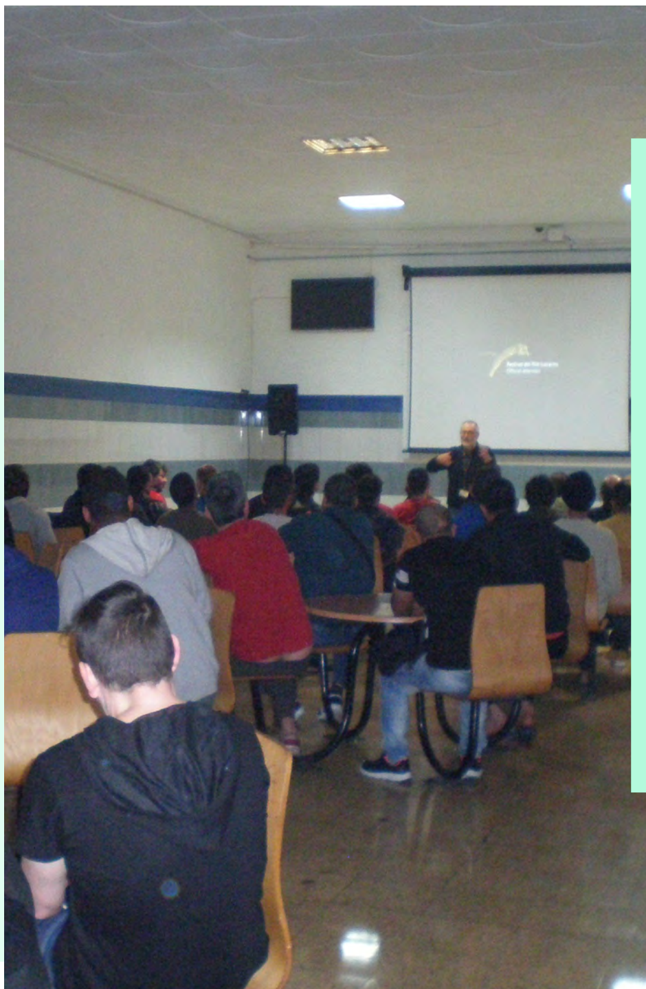
Sesión especial en el centro penitenciario de San Sebastián.