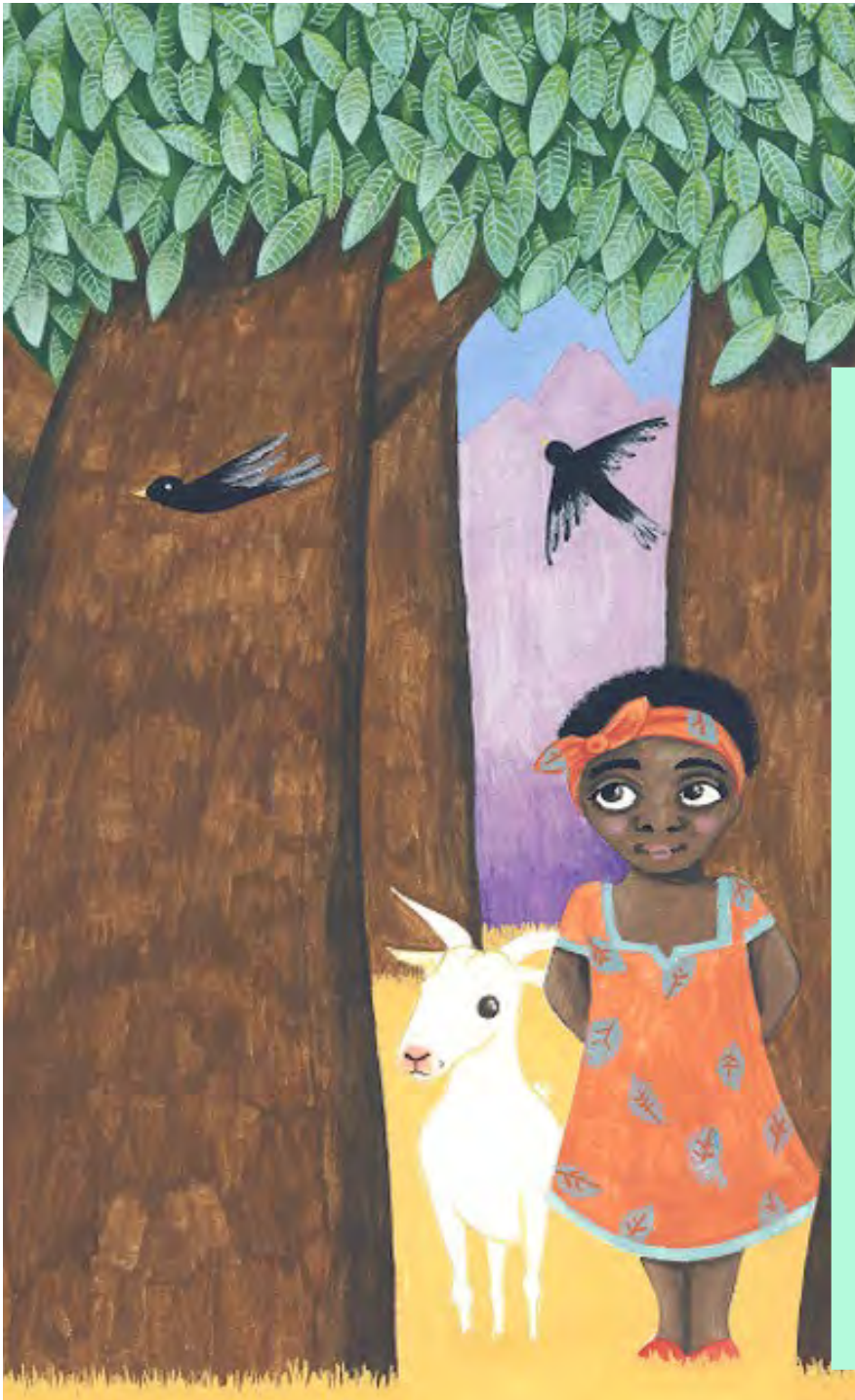
Cartel de la exposición "Wangari Maathai y los árboles de la paz".