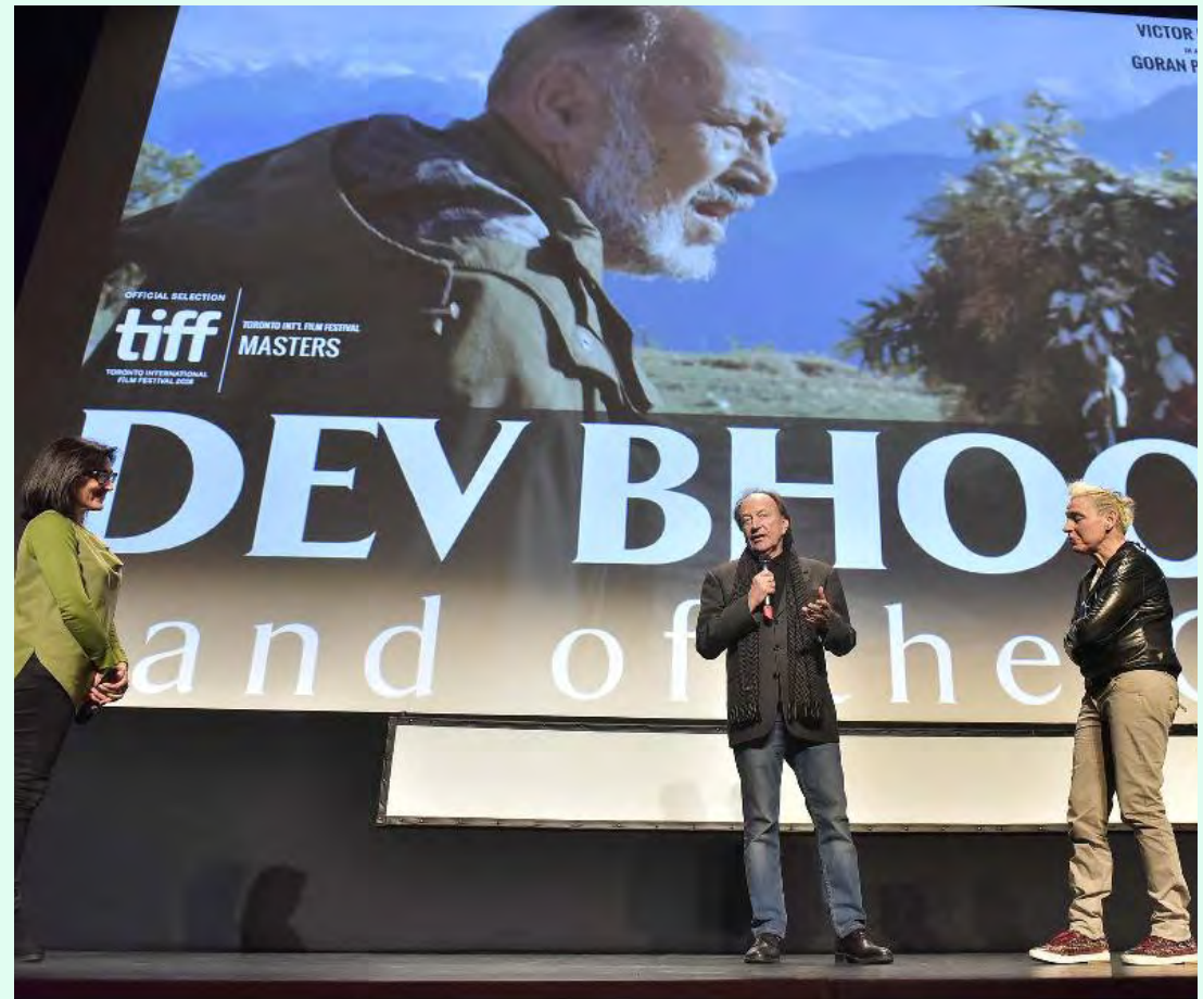
Goran Paskaljevic, presentando su película Land of the Gods .