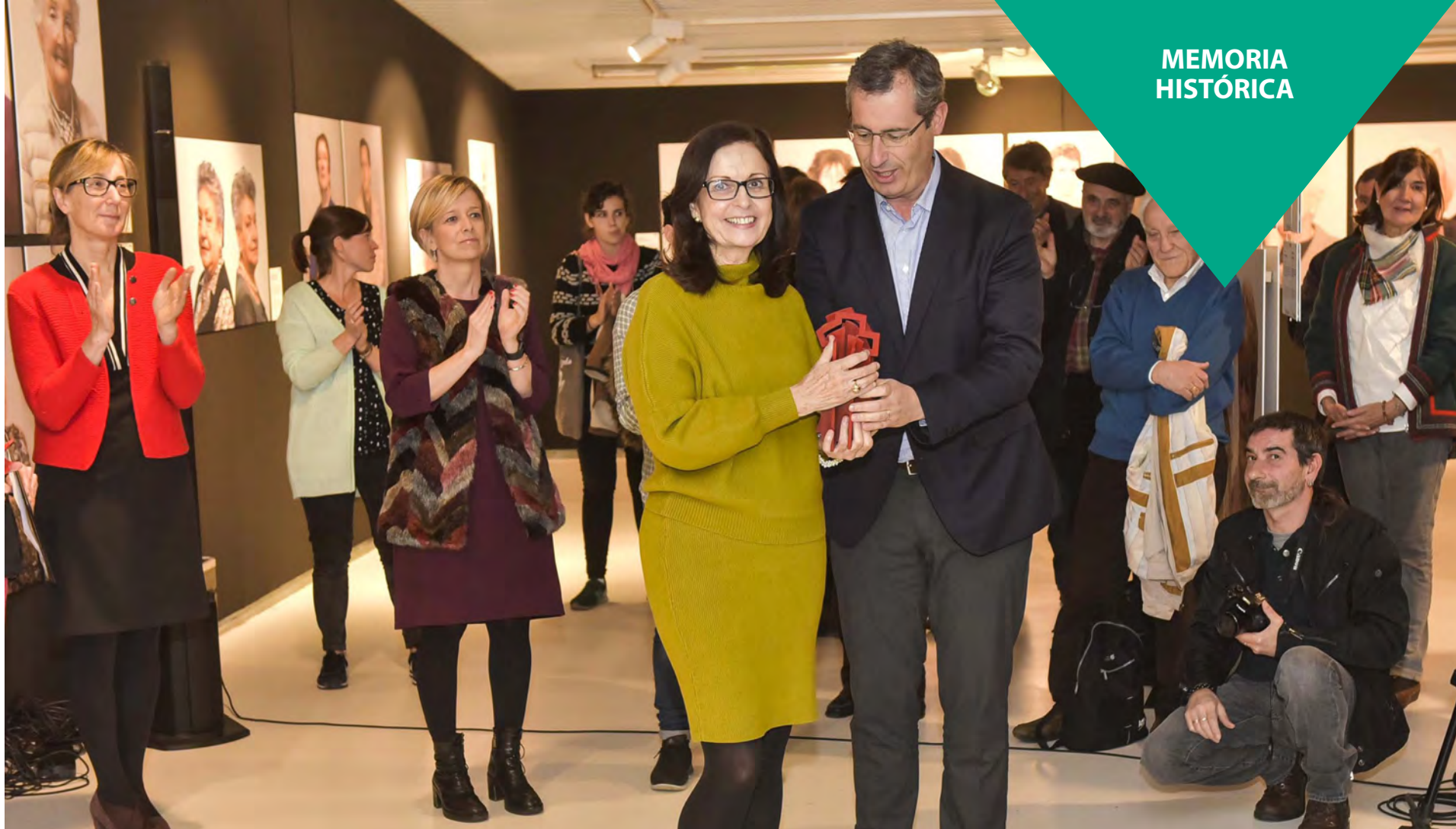
El diputado general, Markel Olano, hace entrega de un recuerdo a una de las protagonistas de la exposición.