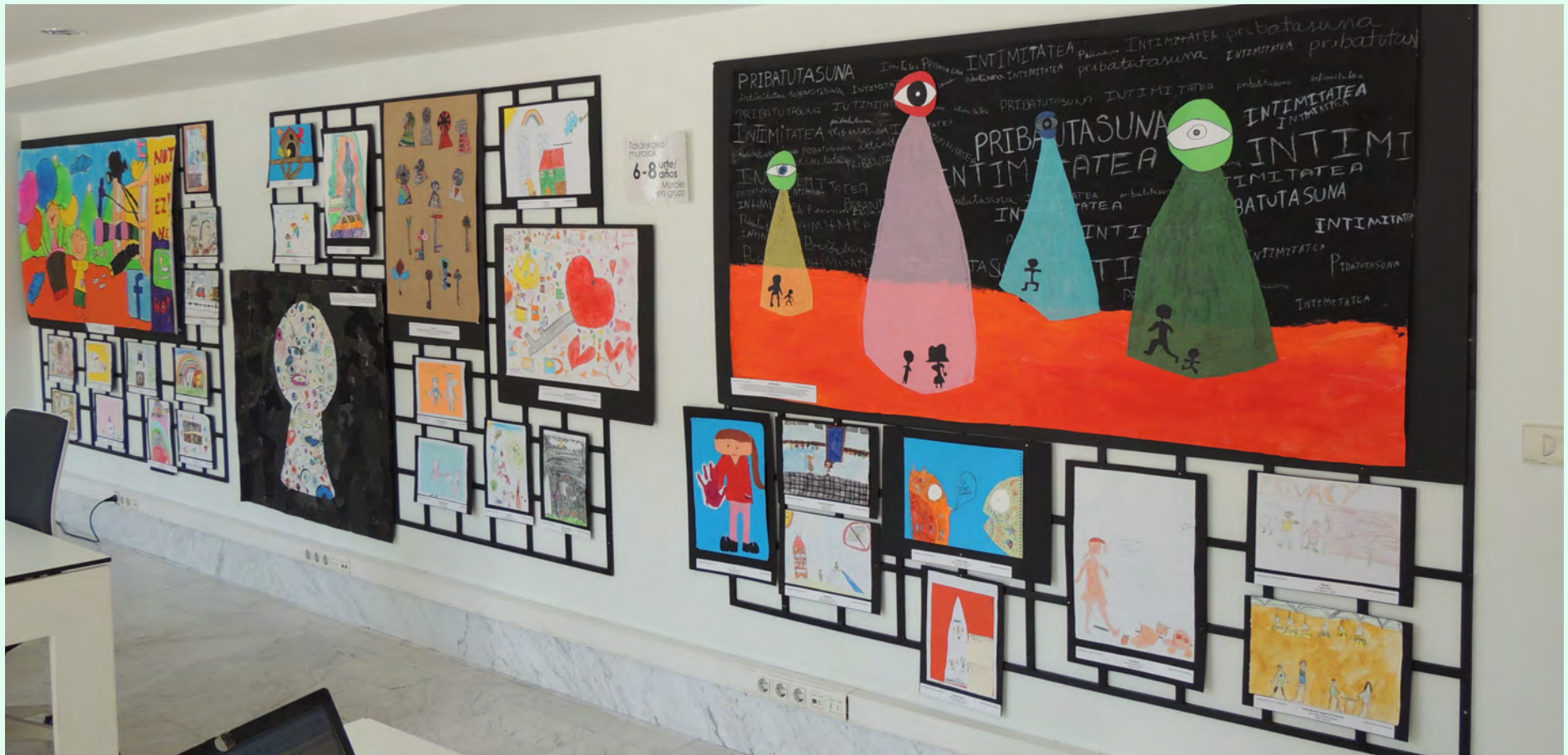
Murales de la exposición de dibujos.