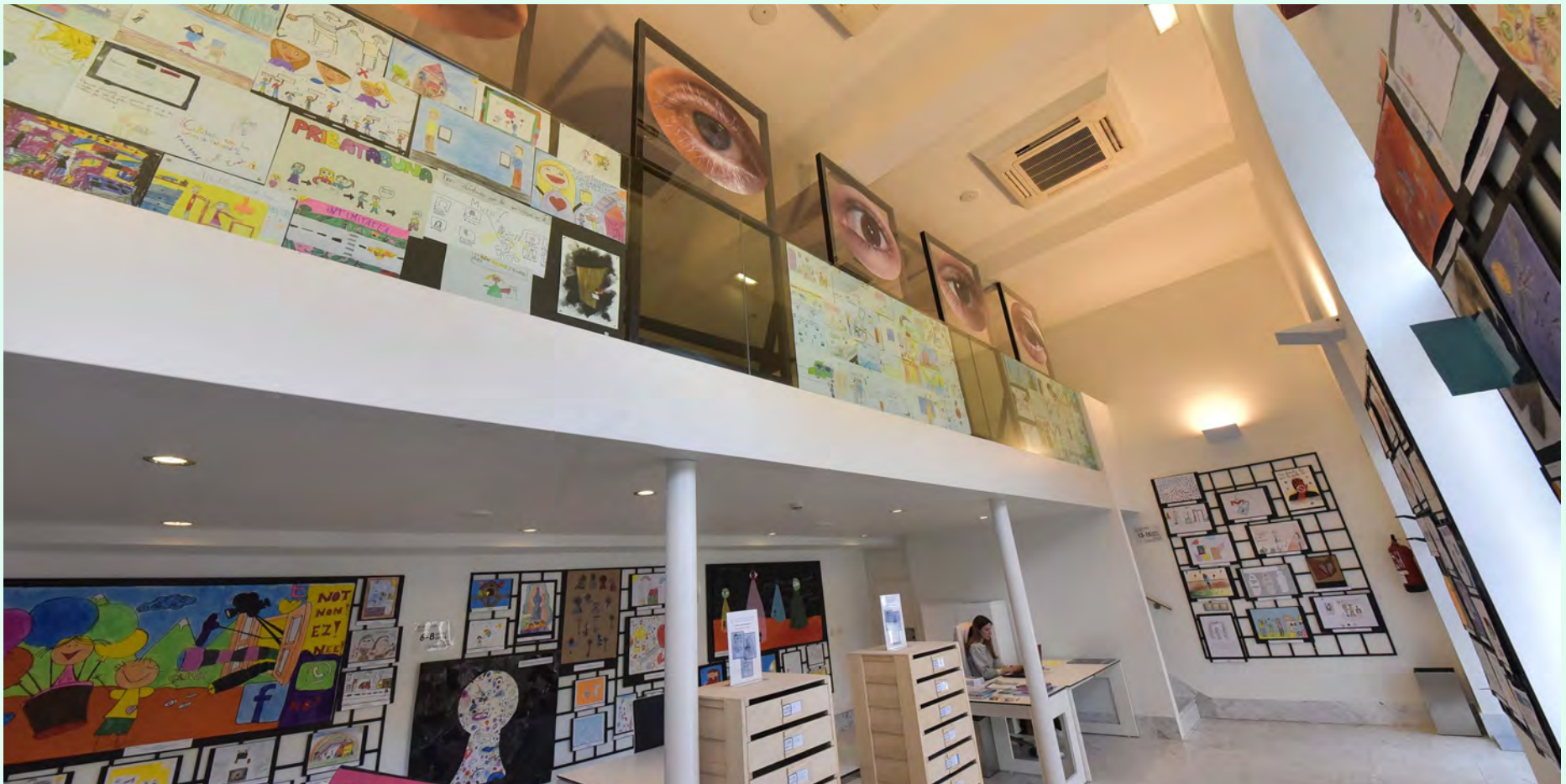
Exposición de dibujos de la 13 edición de Arte y Derechos Humanos, en el Teatro Victoria Eugenia.