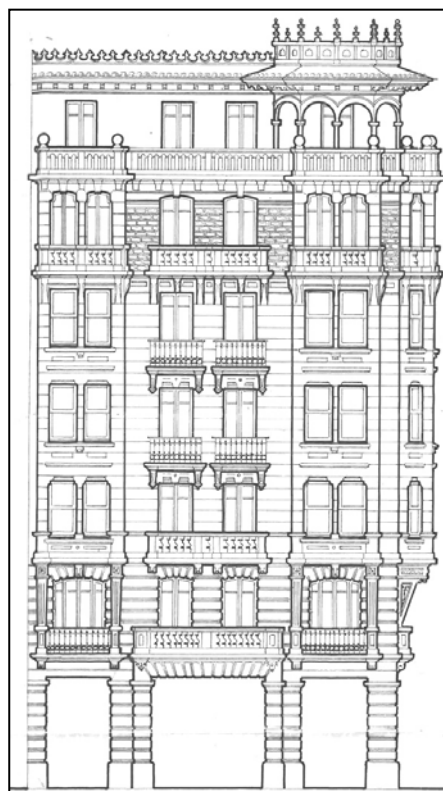
Autor y fecha desconocidos