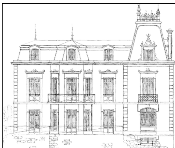
Autor desconocido, hacia 1880, y Luis Elizalde, 1908