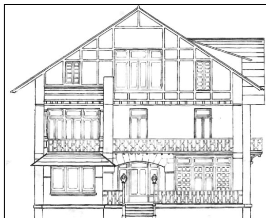
Ramón Cortázar, 1912