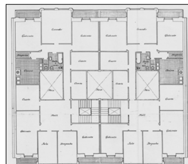
Autor y fecha: Ramón Cortázar; 1917