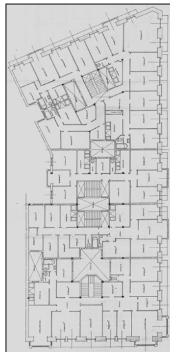
Autor y fecha: Luis Elizalde; 1924.