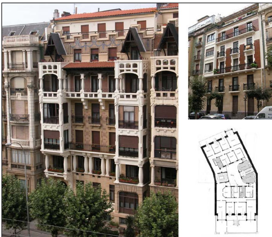
Autor y fecha: Luis Elizalde; 1919.