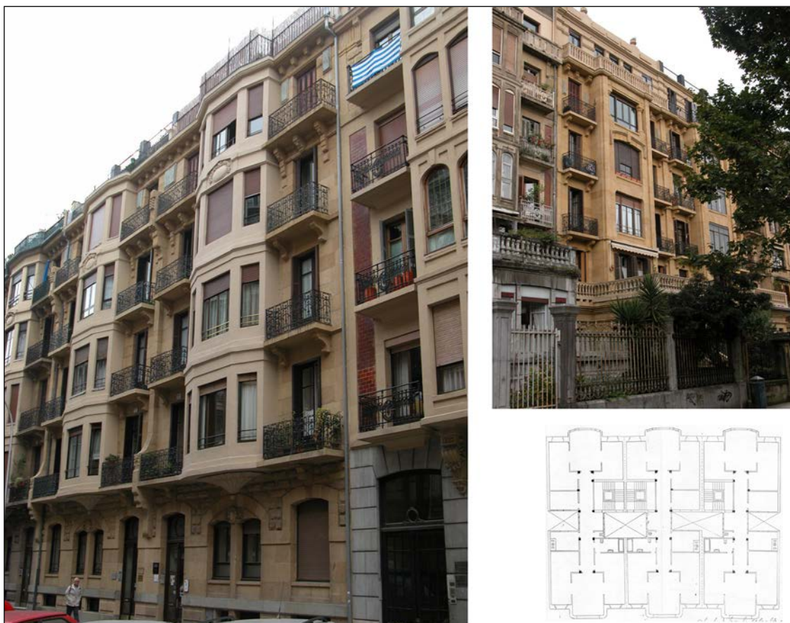
Autor y fecha: Lucas Alday; 1919