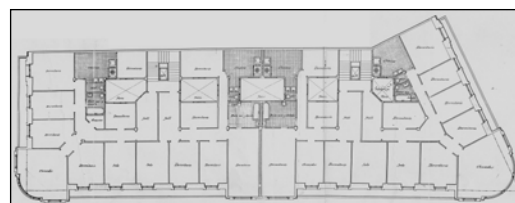
Autor y fecha: Ramón Cortázar; 1918