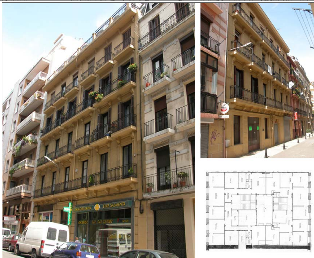
Autor y fecha: Francisco Urcola; 1900.