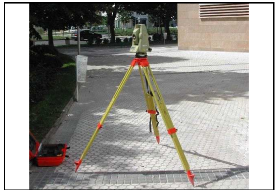
XEHETASUN ARGAZKIA / FOTO DE DETALLE