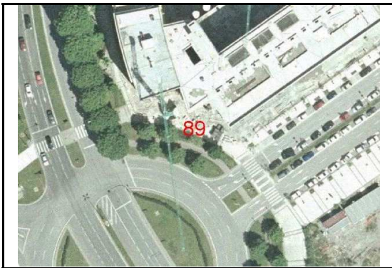
KROKISA / CROQUIS