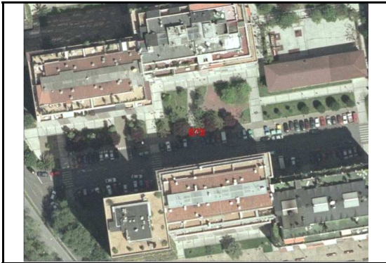
KROKISA / CROQUIS