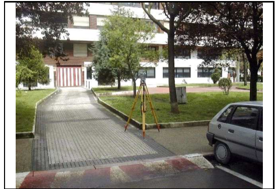
XEHETASUN ARGAZKIA / FOTO DE DETALLE