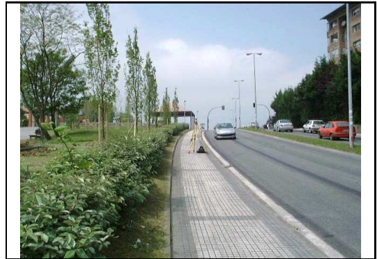
XEHETASUN ARGAZKIA / FOTO DE DETALLE