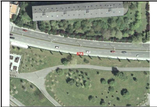
KROKISA / CROQUIS