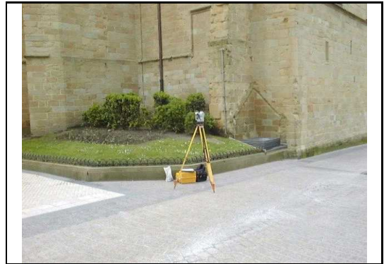
XEHETASUN ARGAZKIA / FOTO DE DETALLE