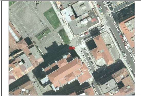
KROKISA / CROQUIS