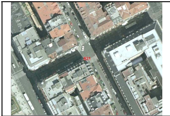
KROKISA / CROQUIS