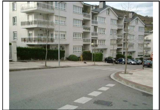
XEHETASUN ARGAZKIA / FOTO DE DETALLE