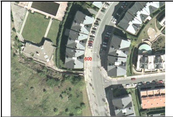
KROKISA / CROQUIS