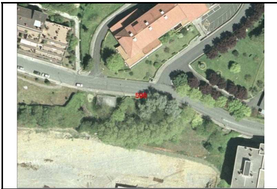
KROKISA / CROQUIS