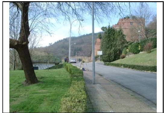
XEHETASUN ARGAZKIA / FOTO DE DETALLE