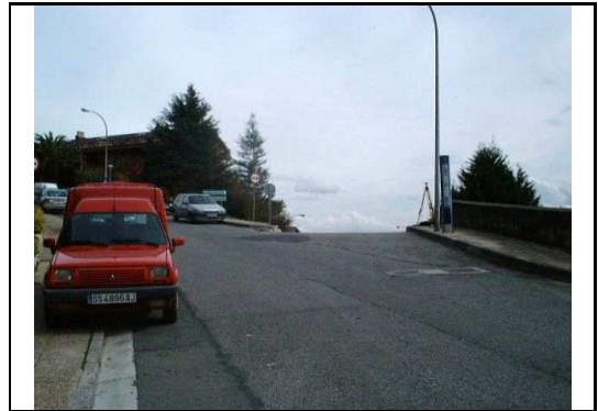
XEHETASUN ARGAZKIA / FOTO DE DETALLE