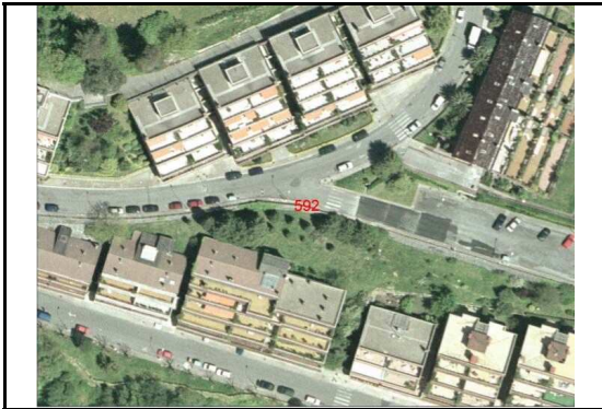
KROKISA / CROQUIS