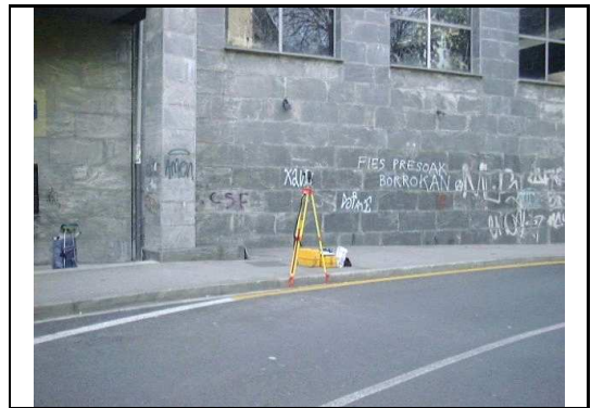
XEHETASUN ARGAZKIA / FOTO DE DETALLE