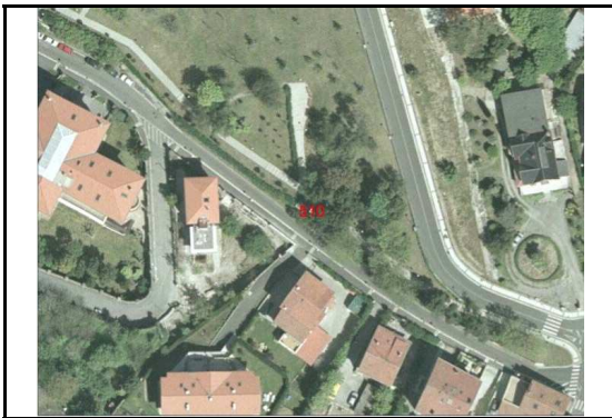
KROKISA / CROQUIS