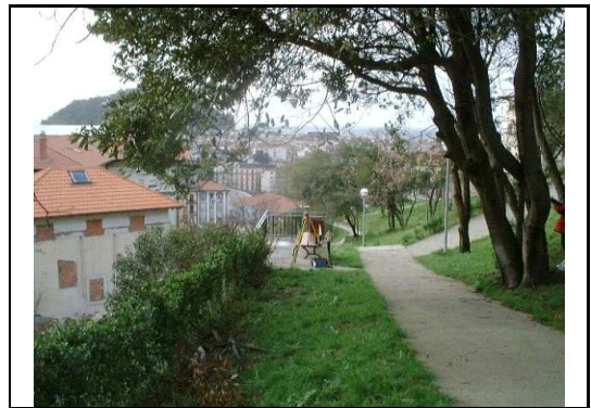
XEHETASUN ARGAZKIA / FOTO DE DETALLE