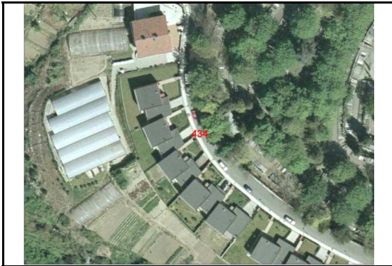
KROKISA / CROQUIS