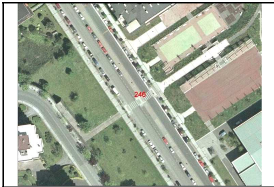
KROKISA / CROQUIS