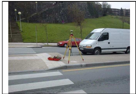
XEHETASUN ARGAZKIA / FOTO DE DETALLE