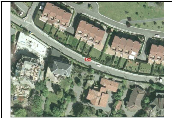
KROKISA / CROQUIS