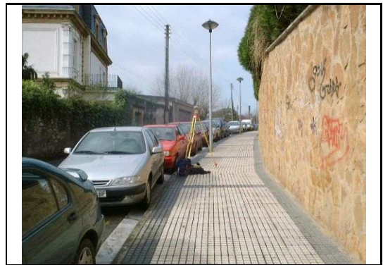
XEHETASUN ARGAZKIA / FOTO DE DETALLE