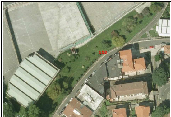
KROKISA / CROQUIS