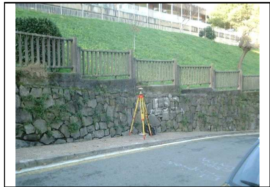
XEHETASUN ARGAZKIA / FOTO DE DETALLE