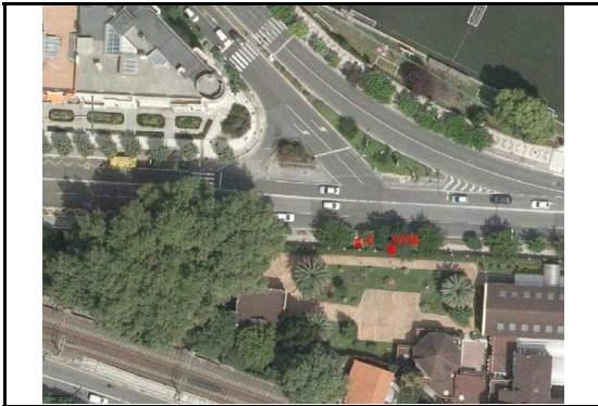
KROKISA / CROQUIS