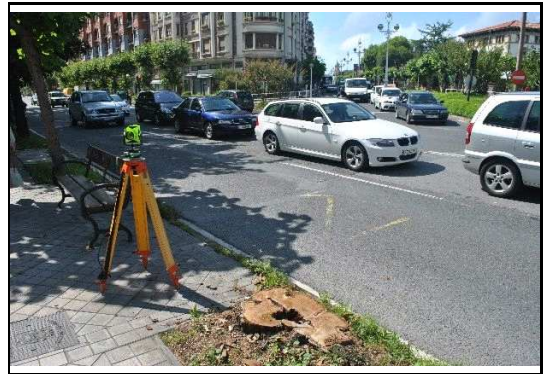
XEHETASUN ARGAZKIA / FOTO DE DETALLE