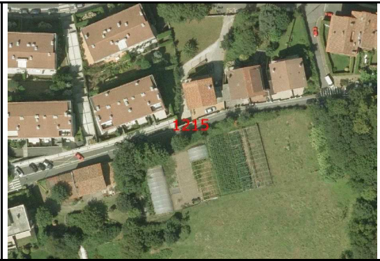
KROKISA / CROQUIS