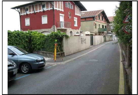
XEHETASUN ARGAZKIA / FOTO DE DETALLE