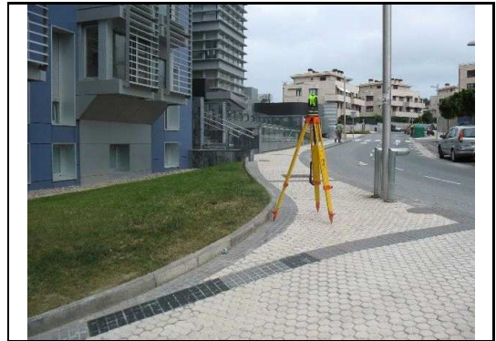
XEHETASUN ARGAZKIA / FOTO DE DETALLE