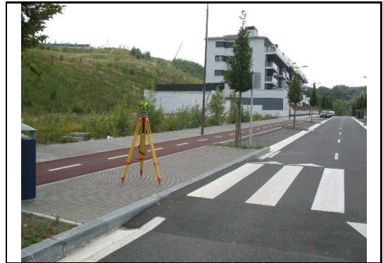
XEHETASUN ARGAZKIA / FOTO DE DETALLE