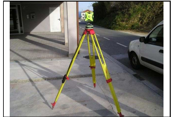
XEHETASUN ARGAZKIA / FOTO DE DETALLE