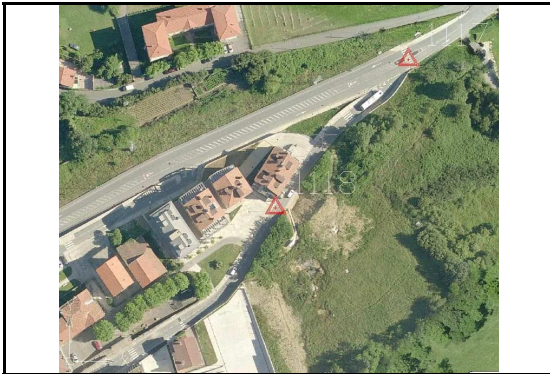
KROKISA / CROQUIS