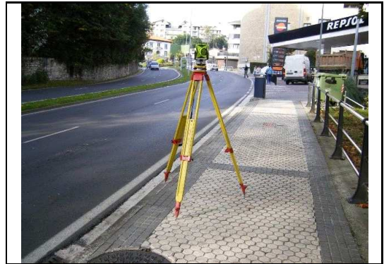
XEHETASUN ARGAZKIA / FOTO DE DETALLE