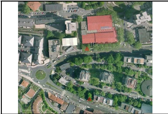
KROKISA / CROQUIS