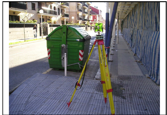
XEHETASUN ARGAZKIA / FOTO DE DETALLE