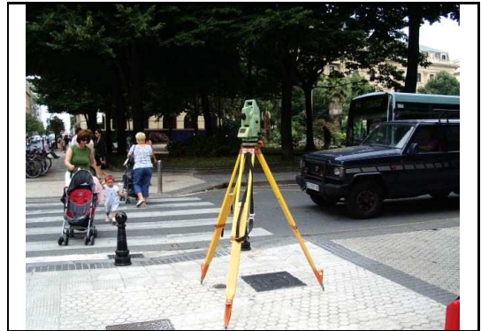
XEHETASUN ARGAZKIA / FOTO DE DETALLE