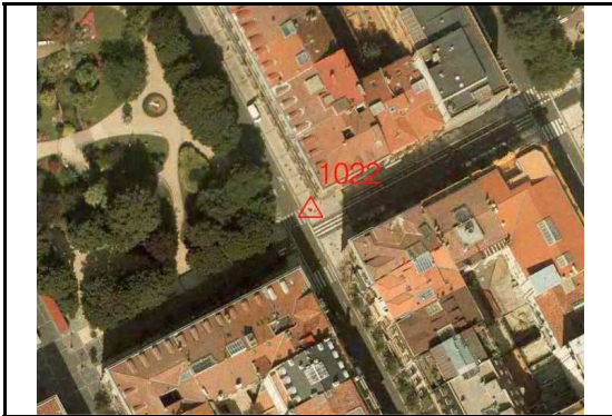
KROKISA / CROQUIS