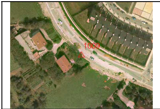
KROKISA / CROQUIS