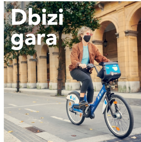
Donostia iraunkorrago batean sinisten dugulako.

Sistema martxan jartzearekin batera informazio kanpaina bat abiarazi da: Dbizi gara. Kanpaina horren bidez, non protagonistak hiritik ibiltzeko bizikleta erabili ohi duten profil desberdineko lau donostiar diren, Dbiziren funtzionamendua erakusten da, eta hiritarrak sistema erabiltzera animatu nahi dira.