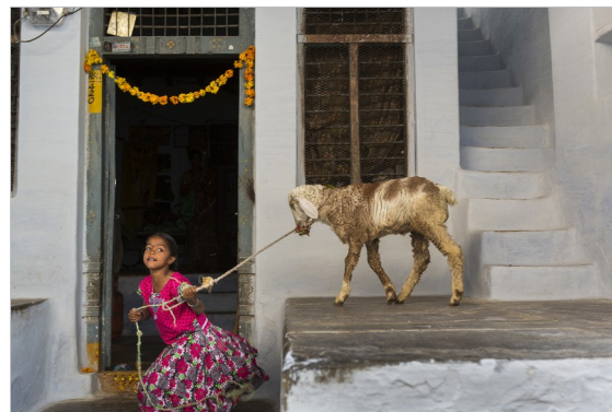
Una niña juega con un cordero en Bukaraya Samudram durante la festividad del Teru.

La muestra ahonda en lo más sensible y mágico del mundo femenino y en la fuerza y la capacidad de superación de las mujeres de Anantapur. La fotógrafa se ha acercado a ellas con un respeto reverencial. Obstinada y desmedida, Cristina García Rodero ha sabido sumergirse en ese mundo, fundirse en la alegría y sufrimiento de quienes encubren con color y apostura los claroscuros de su propia existencia.