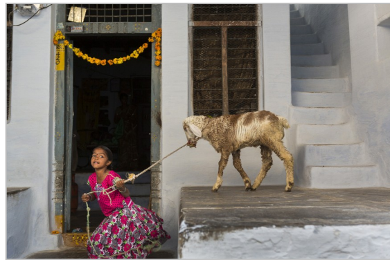
Neskato bat jostetan arkume batekin Bukaraya Samudram-en, Teru izeneko jaian.

Erakusketa emakumeen mundu sentikor eta liluragarrienean barneratu da, bai eta Anantapurko emakumeen indarrean eta gauzak hobetzeko duten gaitasunean ere. Argazkilaria erabateko begirunez hurbildu zaie. Temati eta neurrigabea, Cristina García Roderok ederki jakin du mundu horretan murgiltzen; hain zuzen ere, mundu horretan uztartzen dira emakumeen bizitzaren argi-itzalak kolorez eta liraintasunaz estaltzen dituzten pertsonen alaitasuna eta sufrimenduarekin.