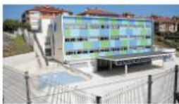
Aiete Ikastetxea Arostegi, 1 Tel: 943297830