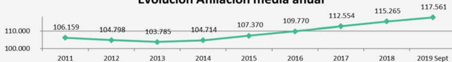
Evolución Afiliación media anual