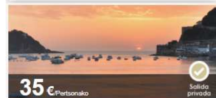
Donostiako onena oinez

Kanpaina sare sozialen bidez, Dbus, Lurraldebus eta online eta offline bidezko komunikazio-bitartekoen bidez zabalduko da.