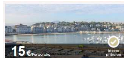
Donostia eta bere funtsa, bisita gidatua