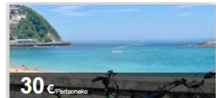
Hiru hondartza bizikleta elektrikoan