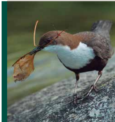
Egilea: Agustin Povedano