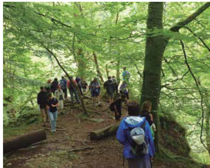
Egilea: Margi Iturriza

Pili: Goizuetako Udalarentzat onuragarria da Donostiako Udala Artikutzaren jabea izatea izan ere, kontutan hartu behar baita erosi zuenean zein egoeratan zegoen, meategiak eta burdinolak zirela eta, basoak kalte handiak jasan zituen eta gaur egun ikus dezakeguna ia ehun urteko lanaren ondorioa dela ezin ahaztu, kalitate oneko ura lortzeko apustu handi bat egin zuten, horri esker Artikutza altxor eder bat bihurtu zaigu, edonoren gozamenerako. Momentu honetan Donostiako Udala eta Goizuetakoa elkar lanean ari gara bi ibilbide prestatzen, Goizarin-Elama burdinolekako ibilbidea eta Goizueta-Artikutza/ Artikutza-Goizueta, natur turismorako oso egokiak, Artikutza, natura maite dugunentzako oso leku berezia da, paregabea esango nuke nik, eta Goizuetarrak ere horrela ikusten dute, askorentzat Artikutzan paseatzea indar berritza da.