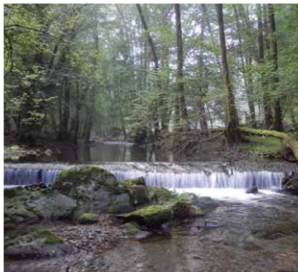
Sasiandiko presa eraitsi aurretik 2014 ko iraila.

Edo Artikutza auzoko etxeak argiztatu eta zerrategia martxan jartzeko beharrezko energia elektrikoa sortzeko zentral txikia martxan jartzea.