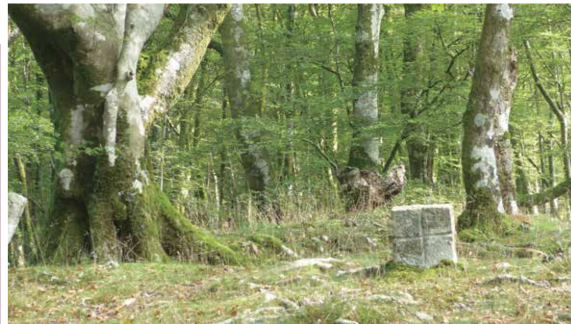
Egilea: Margi Iturriza

Donostiarrei dagokienean, askok ondo ulertzen ez duten bitxikeria da, zenbaitek pentsatzen baitute Donostiak badituela lur publikoak edo herri-lurrak Nafarroan, zehazki, horrela ez denean. Afera administratibo honetaz gain, noski, Donostiar gehienontzat Artikutza urruneko altxor natural bat da.