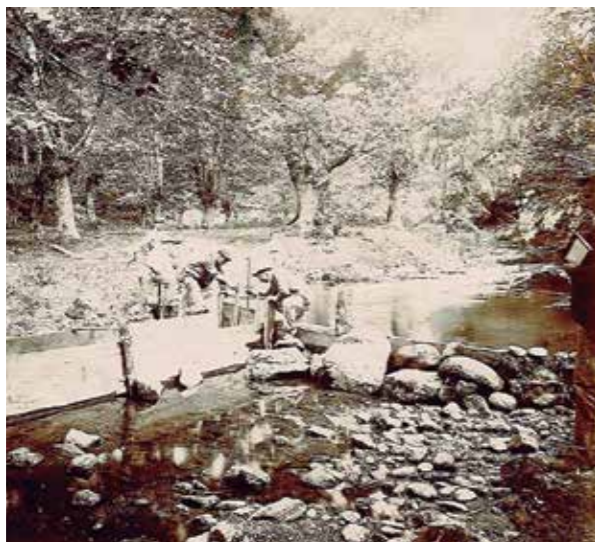
Elama ibaian, Sasiandiko presa eraikitzen 1903 urte inguruan.

XX. mende hasieran eraikitako presa txikiek funtzio argia zuten: errekan barrerak sortzea eta horrela, ur maila igo eta ura kanalen bitartez Donostiako hornikuntza sistemara bideratzea.