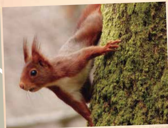
802050005066 Izenburua: Ezkutaketan Tokia: Artikutza