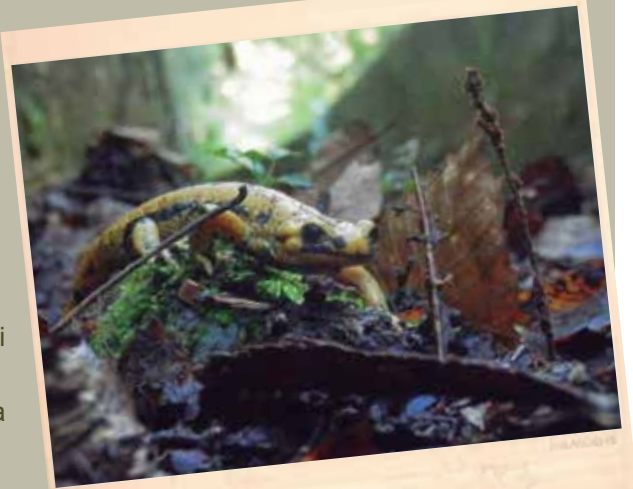
802050005065 Izenburua: Arrabioa Tokia: Erroiarriko kanala

Artikutzako Ttanttak buletina jaso nahi baduzu bidali zure datuak (Izen abizenak, helbide elektronikoa) artikutzanatura@donostia.org helbidera eta posta elektroniko bidez jasoko duzu.