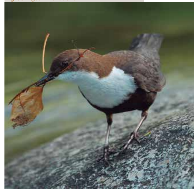
Egilea: Agustin Povedano