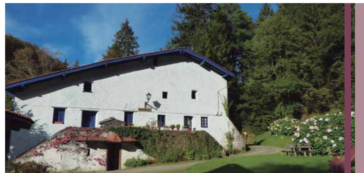
Egilea: Margi Iturriza