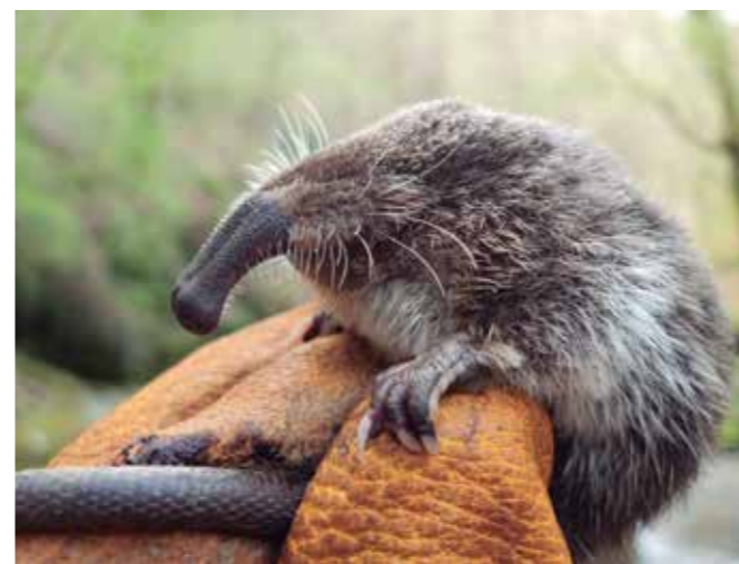
Egilea: Jorge González

Horrez gain, presak botatzearekin ur-zozoa bezalako hegaztien egoera ere hobetzea espero da baita Artikutzako ur azkarretan murgiltzen ikusteko aukera areagotzea ere.