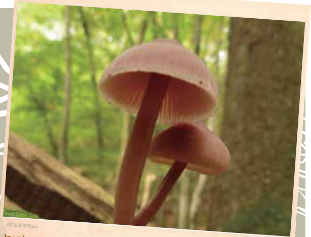
802050005065 Izenburua: Aterkia Tokia: Erroiari ingurutik