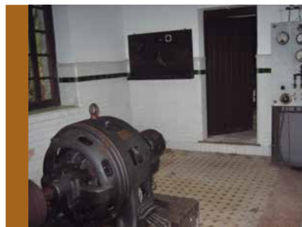
Zentraleko energia sorgailua. Egilea: Margi Iturriza

Edo Artikutza auzoko etxeak argiztatu eta zerrategia martxan jartzeko beharrezko energia elektrikoa sortzeko zentral txikia martxan jartzea.