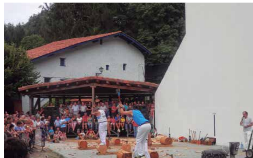
Egilea: Inaki Uranga

Pili: Herritarrek maite dute Artikutza, azken finean gure herriaren auzo bat da, betidanik modu bateko edo besteko lotura izan dugu, mendeetan ekonomia aldetik bertako motorretako bat izan zen; burdinolak, meategiak, ikatz-egileak, abeltzaintza eta baita ere kontrabando kontuak... eta nola ez jaiak, adibidez abuztuak 28an herria ia hustu egiten da, San Agustin eguna Artikutzan ospatu behar da, egun pasa familian edo lagunekin eginez, auzoa bisitatuz lagun zaharrak ikusiz... herritar askok diote herriko festaren azken eguna abuztuaren 28a dela.