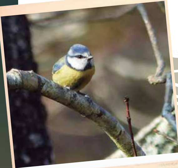
802050005064 Izenburua: Amilotx urdina Tokia: Artikutzako basoan

Artikutzan atera duzun argazki polit edo bixi bat hemen argitaratua ikusi nahi baduzu, bidali helbide honetara: artikutzanatura@donostia.org . Argazkiarekin batera zure izen - abizenak, ateratako lekuaren izena, data eta argazkiaren izenburua jar itzazu.