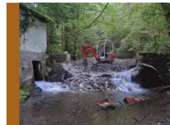
Urdallueko presa txikiaren erasketa.

Gaur egun eraikuntza hauek zaharkituta geratu dira eta ez dute funtziorik betetzen: Donostiako ur hornikuntza 1975 urtea ezker, Añarbeko presatik egiten da. 1922an martxan jarri zen zentrala, aldiz, ez dago funtzionamenduan 80. hamarkadatik.