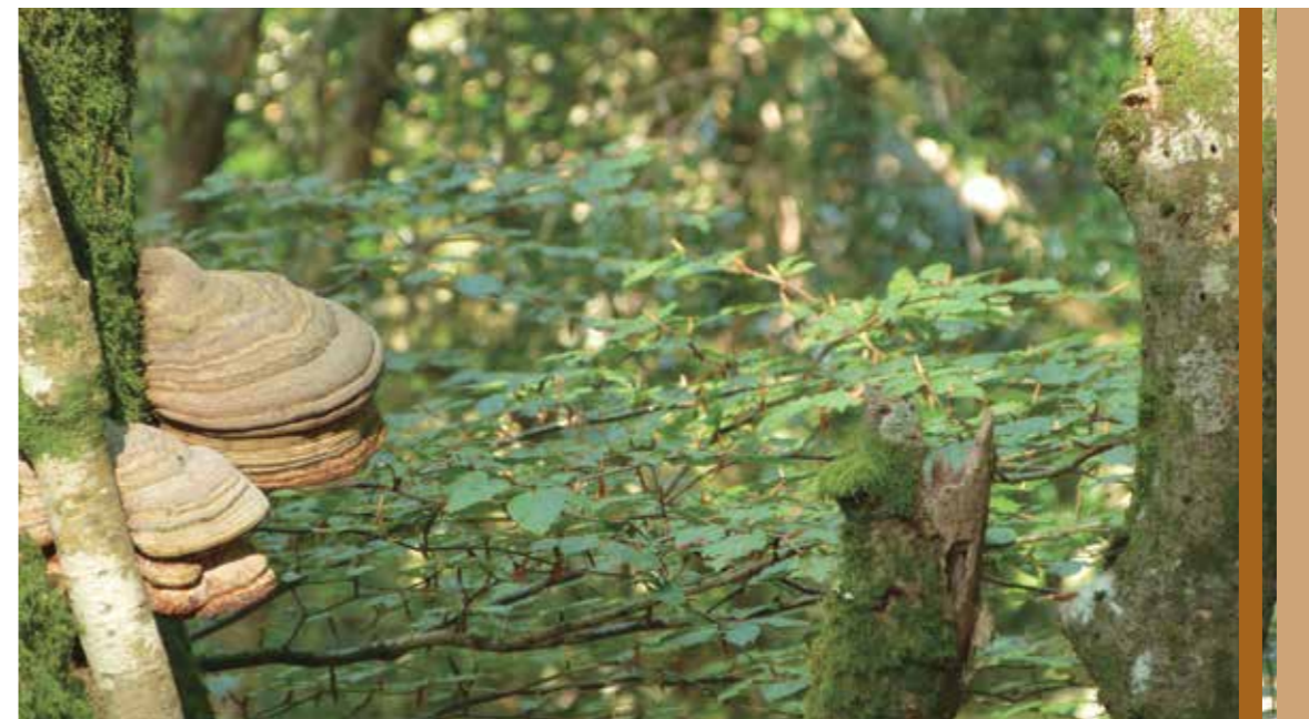
Egilea: Margi Iturriza

Axier: Loitzate mendia, Artikutzaren hegoaldeko mendialdean. Batetik, mendizale naizenez, toki garaiak gustatzen zaizkidalako. Bestetik, nahiko leku basatia delako eta jende gutxi ibiltzen dena. Eta hirugarrenik eta bereziki, Artikutza osoa, bere zabalera, baso eta ibarrak eta munduan kokatuta, mugatzen dituen herrixka eta inguruneak ikusteko talaia paregabea delako.