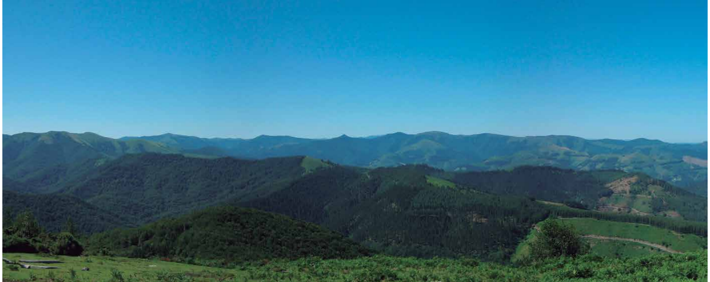
Egilea: Margi Iturriza

6. Artikutza, entzuna bezain ezezaguna leloa behin baino gehiagotan entzun dugu, egia al da?