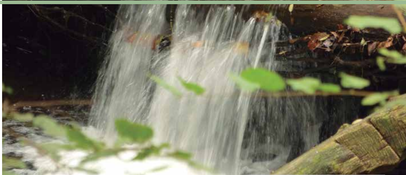
Artikutza erreka. Egilea: Margi Iturriza