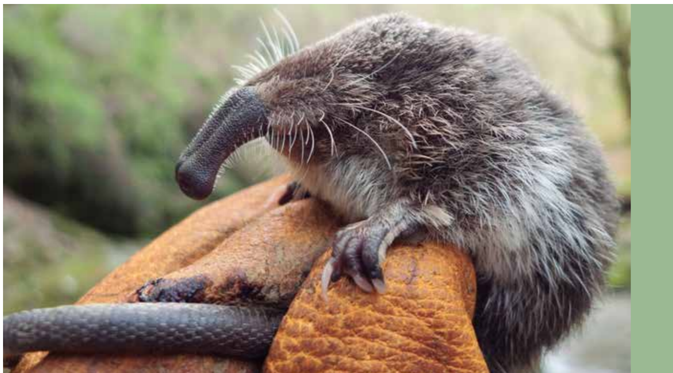
Egilea: Jorge González

Eta batez ere, bisitatzen duten herritarrek errespetuz joko dezatela Artikutzako ingurunearekin, eta ingurumen-kontzientziak zabaldu eta indartzeko iturri izan dadila.