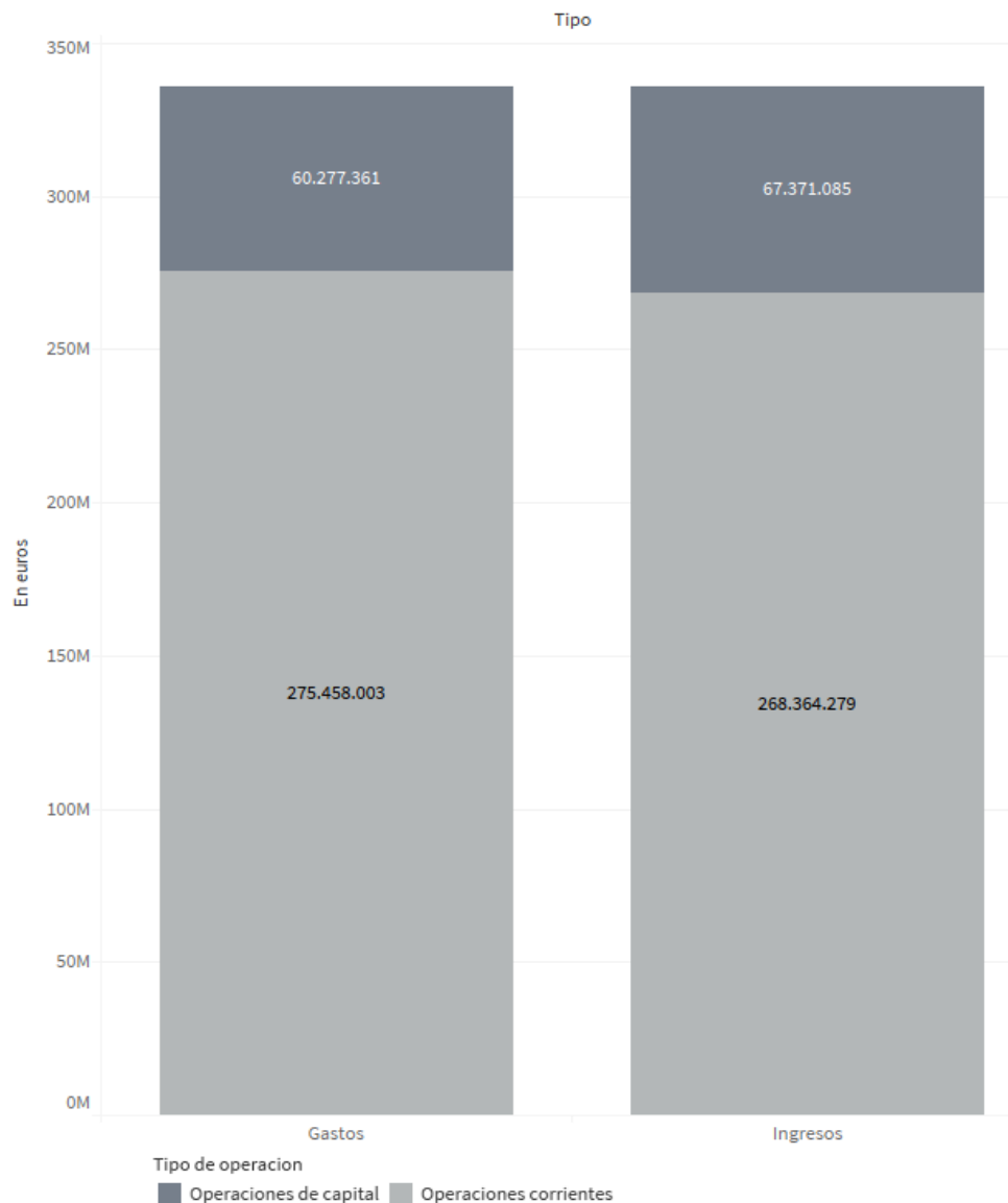
Presupuesto 2017 (Ayuntamiento)

Los ingresos corrientes municipales ascienden a 275.458.003,18 euros y los gastos corrientes municipales a 268.364.279,46 euros de los cuales 58.853.769,05 euros constituyen la aportación municipal necesaria para que cada uno de los Organismos Autónomos, Entidad Pública Empresarial y Sociedades equilibre su presupuesto corriente. Existe por tanto un excedente que se destina a financiación de inversiones por un importe de 7.093.723,72 euros.