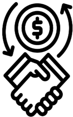
LAN ZEHATZETARAKO KONTRATUA