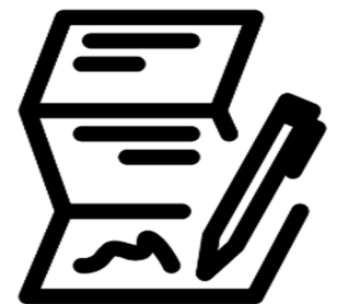
ALDI BATERAKO KONTRATUA