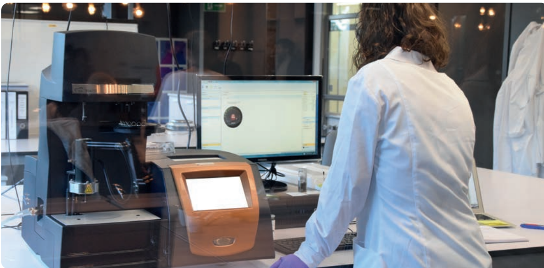
Donostia, zientzia eta ezagutzaren hiria.