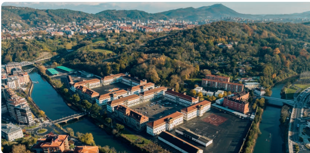
Loiolako Kuartelak eta Ametzagaina parkea.