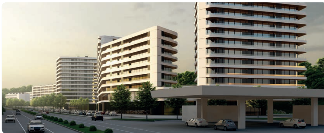
Infernuan bizitegi-gune berria.