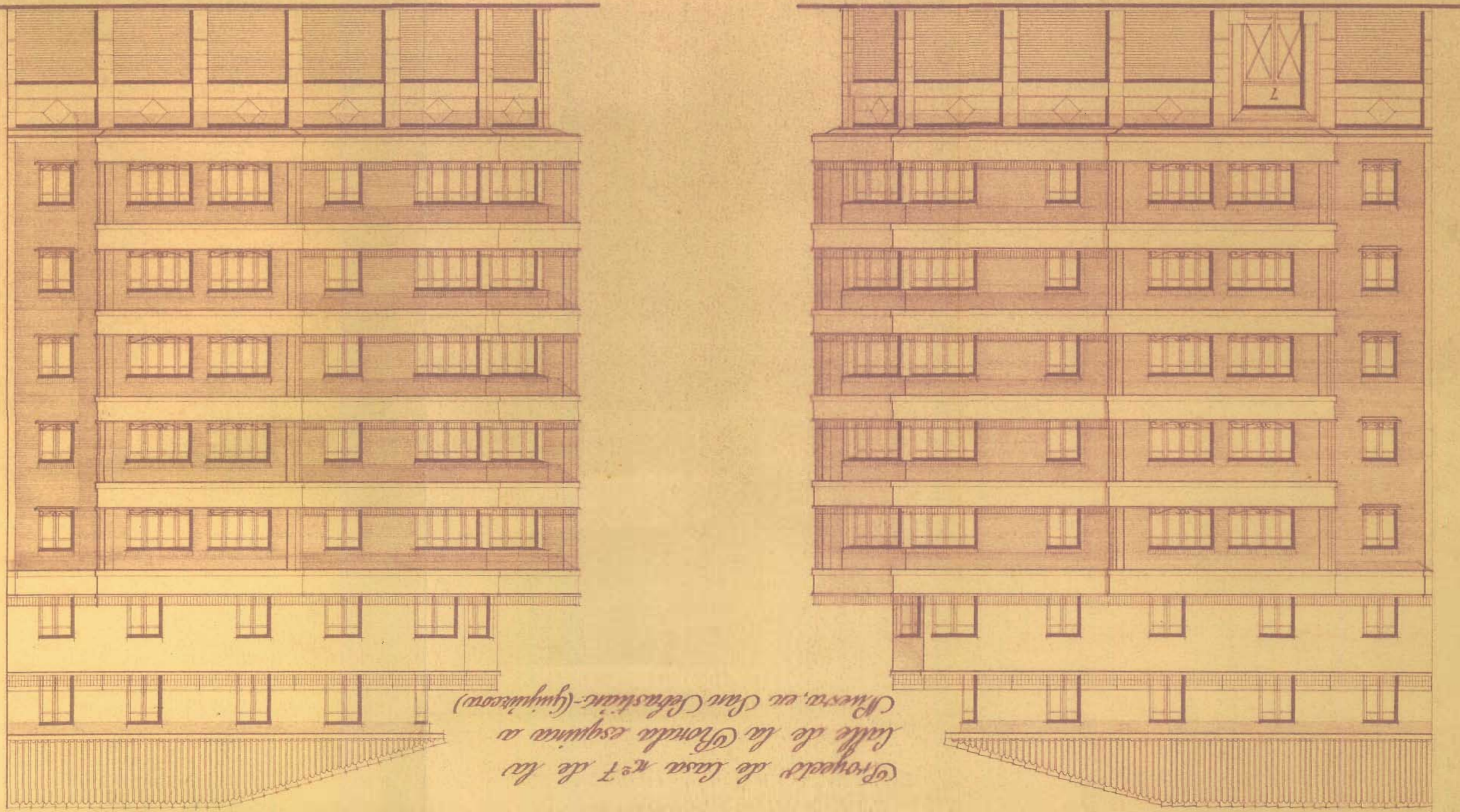
Fachada a la Calle de la Chondu.

Proyecto de Casa N.º 7 de la Calle de la Chondu esquina a Miesta, en San Sebastián (Guzústeo)