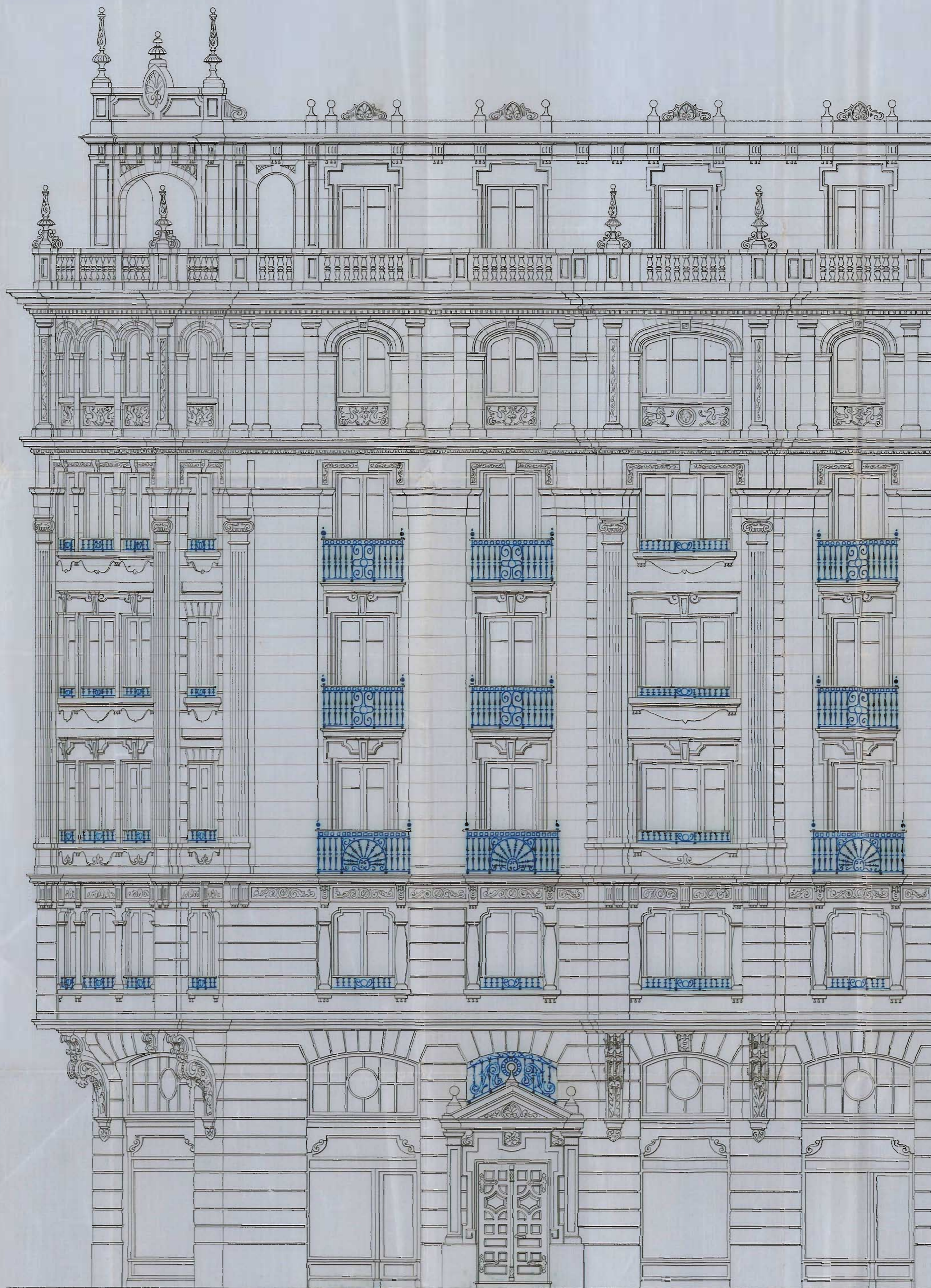
FACHADA A LA CALLE RONDA