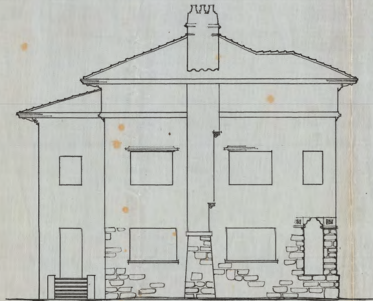
FACHADA LATERAL IZQ a