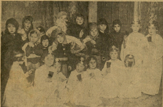
Niños que tomaron parte en la fiesta celebrada ayer por el Colegio Alemán. (Foto Willy Koch).