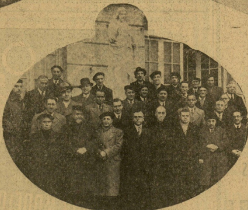
Concurrentes al día de retiro mensual extraordinario celebrado el domingo último por la Legión Católica de San Sebastián. (Fot. Photo-Carte).