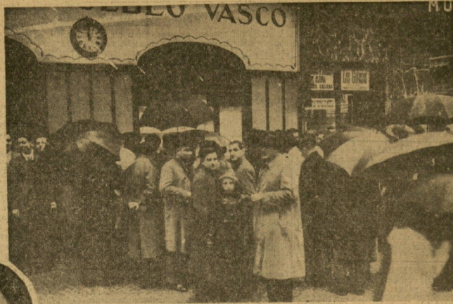
Al filo del mediodía, ya los "gordos" en la calle, el público comenta ante nuestra vidriera la mejor o peor parte de cada uno.