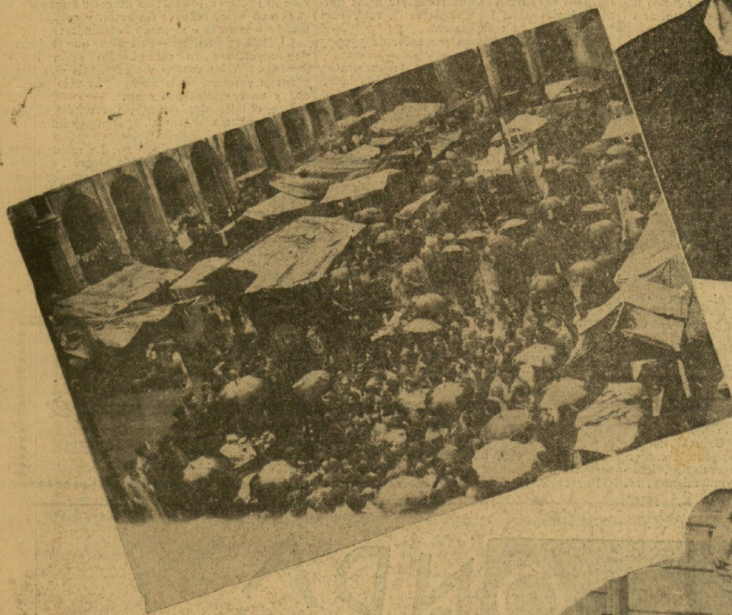
Mal día el de ayer para los feriantes de la Plaza de la Constitución. El invierno hizo su presentación con un tiempo de lo peor de su repertorio, por lo que los puestos de Santo Tomás se tuvieron que cubrir con toldos y los compradores con paraguas. Y así no hay manera de hacer un negocio lucido.