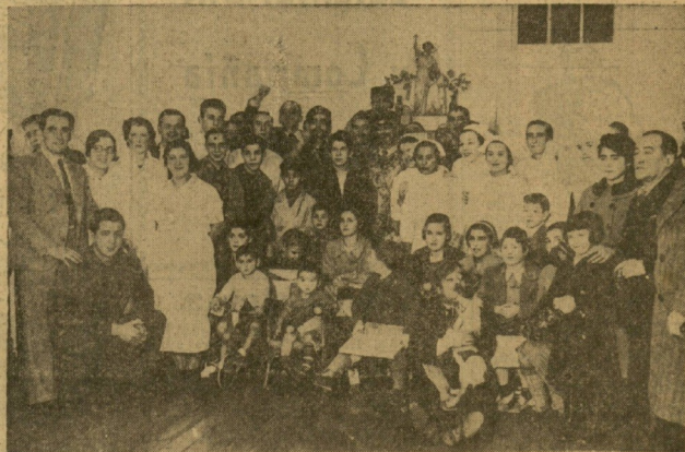
Reparto de juguetes efectuado ayer por socios de Euskal-Billera a los niños del Hospital de San Antonio Abad.