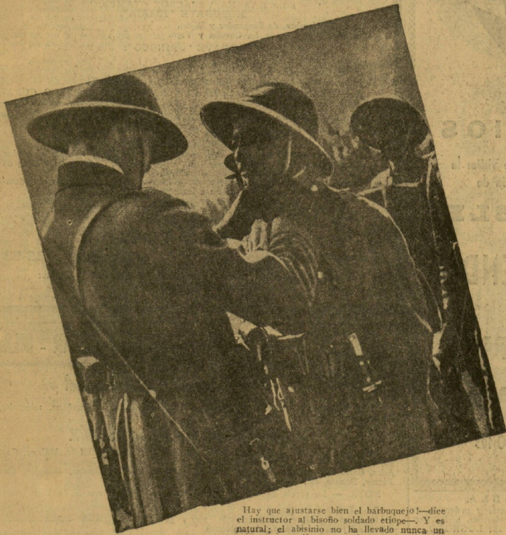
Hay que ajustarse bien al barbuquejo—dice el instructor al bisoño soldado etíope—. Y es natural; el abisinio no ha llevado nunca un uniforme tan flamante.