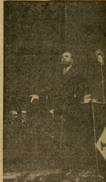
Una actitud del señor Gil Robles.