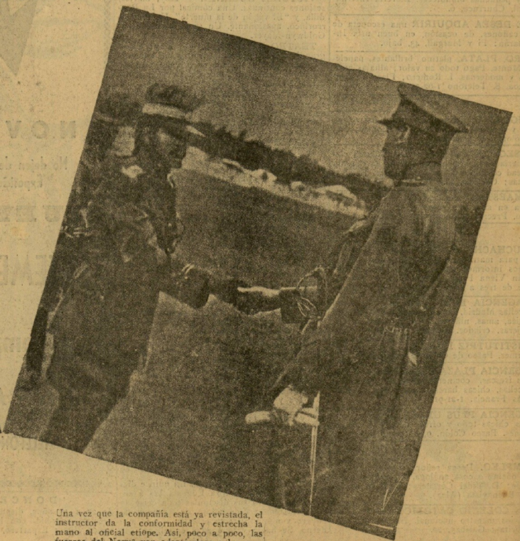
Una vez que la compañía está ya revista, el instructor da la conformidad y estrecha la mano al oficial etíope. Así, poco a poco, las fuerzas del Negus van adaptándose a las normas modernas.